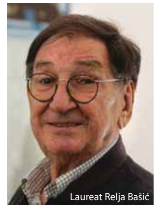
Laureat Relja Bašić

Jednom od najcjenjenijih i najpopularnijih hrvatskih glumaca uopće Relji Bašiću ova je godina – godina nagrada. Nakon Vjesnikove nagrade Krešo Golik ugledni je dramski umjetnik dobio i nagradu Fabijan Šovagović Društva hrvatskih filmskih redatelja (DHFR). Nagrada se tradicionalno dodjeljuje u sklopu programa Festivala igranog filma u Puli, a laureatu će svečano biti uručena danas u 13 sati u projekcijskoj dvorani Zajednice Talijana (Circolo). Tom će prigodom biti prikazan dokumentarni kolaž o Relji Bašiću autorice Tanje Golić naslovljen Relja Bašić u filmovima hrvatskih filmskih redatelja . Film je realiziran u suradnji s Hrvatskim filmskim savezom, a uz inserte koji će podsjetiti na najpoznatije Bašićeve filmske uloge, o velikom glumcu govore redatelji Vatroslav Mimica, Eduard Galić, Lordan Zafranović, Fadil Hadžić, Bogdan Žižić, Hrvoje Hribar, Bruno Gamulin, Petar Krelja i Krsto Papić. Godišnju nagradu Fabijan Šovagović utemeljilo je Društvo hrvatskih filmskih redatelja štujući uspomenu na velikana hrvatskog glumišta Fabijana Šovagovića. Nagrada se dodjeljuje glumici ili glumcu čije je djelo ostavilo trajan trag u povijesti hrvatskog filma. Ocjenjivački sud Društva hrvatskih filmskih redatelja u sastavu Arsen Anton Ostojić kao predsjednik te Saša Vojković i Zvonimir Jurić kao članovi jednoglasno je odlučio da nagrada Fabijan Šovagović u 2009.-oj pripadne glumcu Relji Bašiću. Gospodinu Bašiću, čestitamo u ime Festivala!