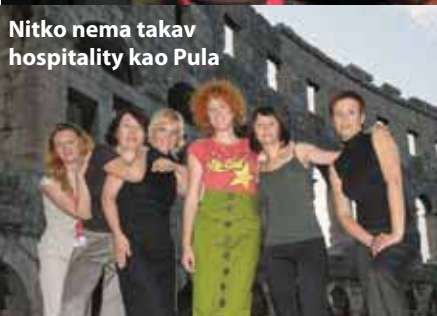
Nitko nema takav hospitality kao Pula