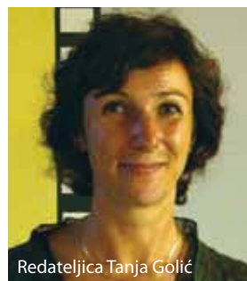
Redateljica Tanja Golić