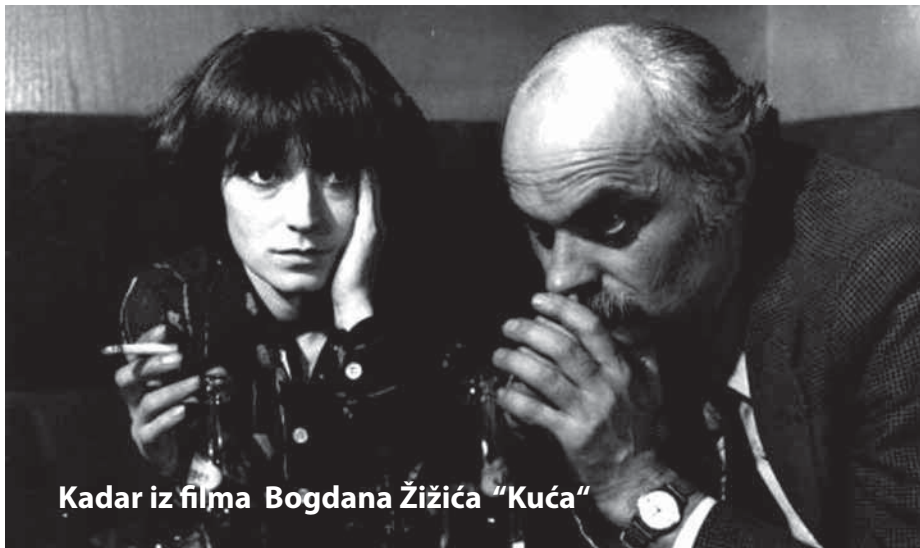
Kadar iz filma Bogdana Žižića "Kuća"

i srednjemetražnih filmova i pet dugometražnih igranih filmova, snimljenih pretežno prema vlastitim scenarijima. Kao redatelj debitira dokumentarnim filmom Poplava . Početkom sedamdesetih realizira niz kratkih igranih filmova, u rasponu od stiliziranih s komponentama fantastike i nadrealizma ( Madeleine, mon amour! , Putovanje ) do onih eksplicitnije suvremene tematike ( Moji dragi susjedi , Šala , Nož , Posljednja utrka ). Prvim dugometražnim filmom Kuća (1975) osvaja Veliku zlatnu arenu . Taj uspjeh ponavlja i filmom Ne naginji se van . Zatim snima filmove Daj što daš , Rani snijeg u Münchenu i Cijena života . Među kratkim filmovima ističu se Ivana , Ekspressionizam u hrvatskom slikarstvu , Emanuel Vidović , Presa i Jedan život . Nagrađivan je na međunarodnim festivalima kratkometražnog filma, a snimao je igrane i dokumentarne filmove u inozemstvu.