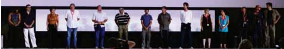
Ekipa filma Crnci na pozornici Arene