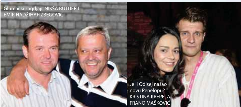
Glumački zagrljaji: NIKŠA BUTIJER I EMIR HADŽIHAFIZBEGOVIĆ