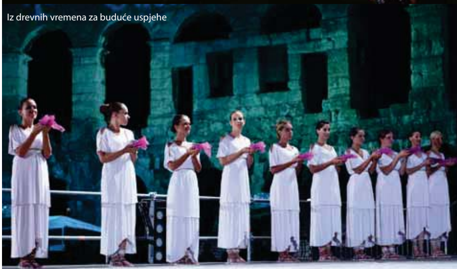
Iz drevnih vremena za buduće uspjehe