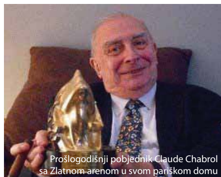
Prošlogodišnji pobjednik Claude Chabrol sa Zlatnom arenom u svom pariškom domu

Claude Chabrol jedan je od pokretača francuskog Novog vala i ubraja se među najutjecajnije svjetske redatelje i scenariste. Debitira 1958. filmom Lijepi Serge ( Le Beau Serge ), a 1959. filmom Rodaci ( Les Cousins ) osvaja Zlatnog medvjeda na Berlinalu. Etalirao se psihološkim trilerima snažnih zapleta i karakterizacije. Iznimno je produktivan autor; režirao je sedamdesetak kinofilmova, televizijskih filmova i serija, među kojima se izdvajaju: Naivne djevojke ( Les Bonnes femmes ), Košute ( Les Biches ), Nevjerna žena ( La Femme infidèle ), Mesar ( Le Boucher ), Izvršenje ( La Cérémonie ).