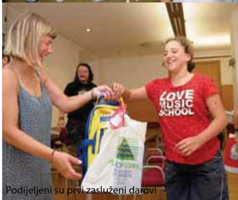
Podijeljeni su prvi zasluženi darovi

Pretežno sunčano s malom do umjerenom naoblakom. Puhat će slaba do umjereni bura. Svježije. Najniža jutarnja temperatura zraka uglavnom od 18 do 23, a najviša dnevna od 26 do 31 °C.