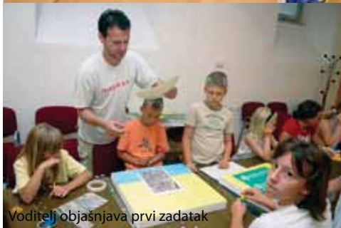
Voditelj objašnjava prvi zadatak