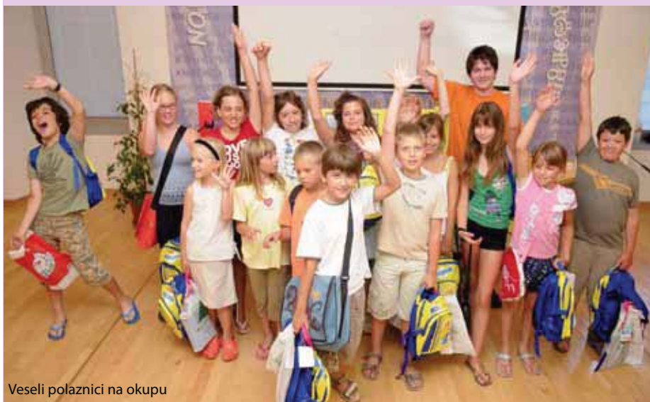
Veseli polaznici na okupu