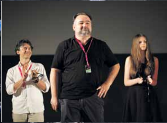
Ekipo filma Slučajni prolaznik u Areni