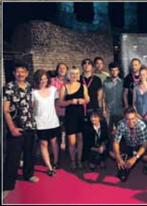
Ekipo filma Zagrebačke p...