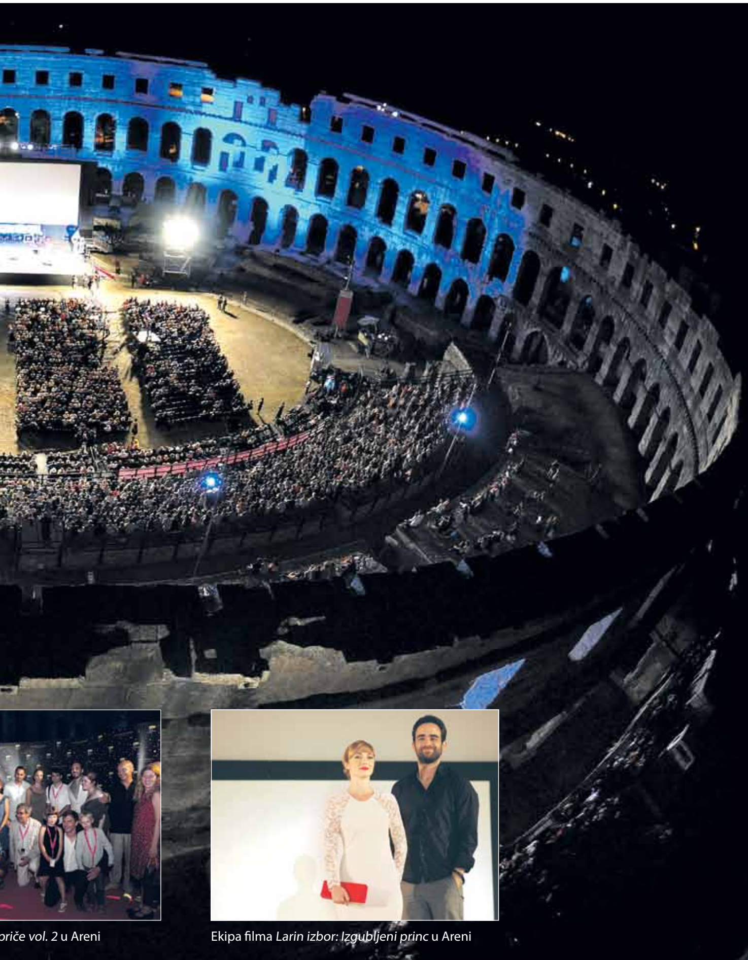
priče vol. 2 u Areni