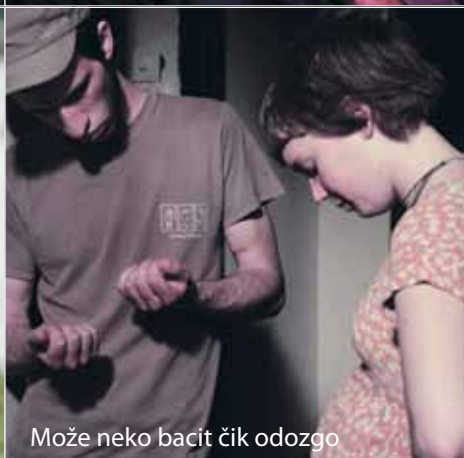
Može neko bacit čik odozgo