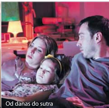
Od danas do sutra