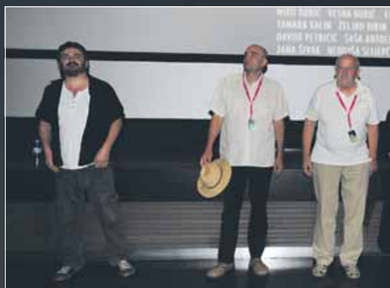
Ekipa filma Pismo ćaći u Kinu Valli