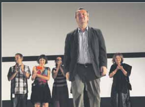
Ekipa filma Noćni brodovi u Areni