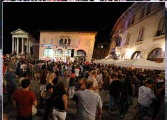
Glazbeni program na Forumu