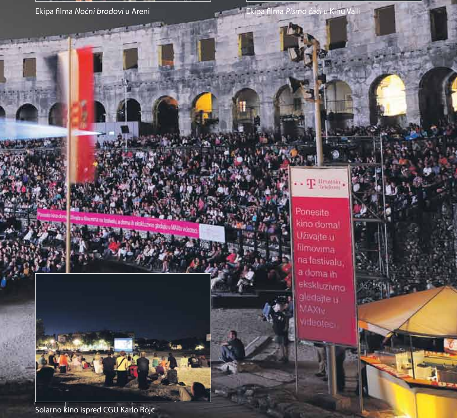
Solarno kino ispred CGU Karlo Rojč