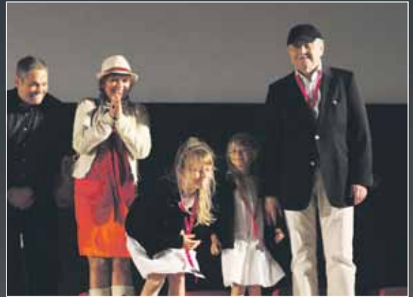
Ekipo filma Cvjetni trg u Areni