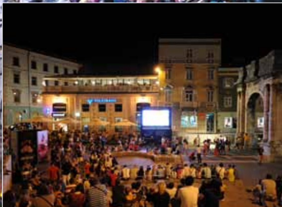
Filmski program na Portarati