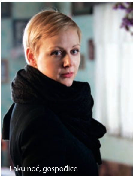
Laku noć, gospođice

Čini mi se da nagrade ne utječu na gledanost, osim možda Oscara. Međutim, ni filmovi nagrađeni Oscarom u kinima ne prolaze uvijek najbolje. Nikad nisam mislio da ću dobiti Zlatnu Arenu, tako da sam bio stvarno ugodno iznenađen.