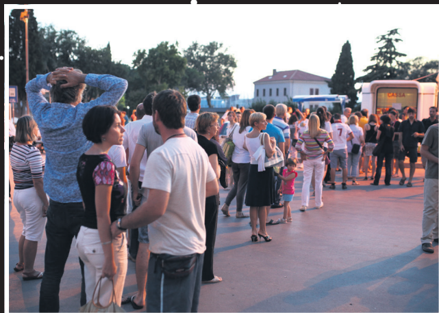
Nadam se da će još biti karata kad dodem na red