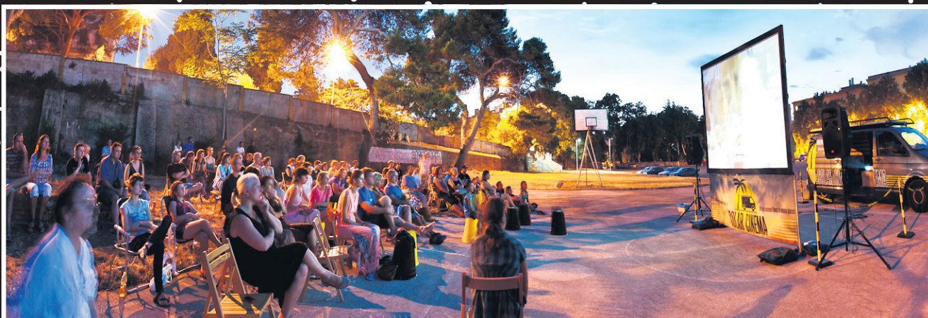
Solarno kino - CGU Rojc Pula