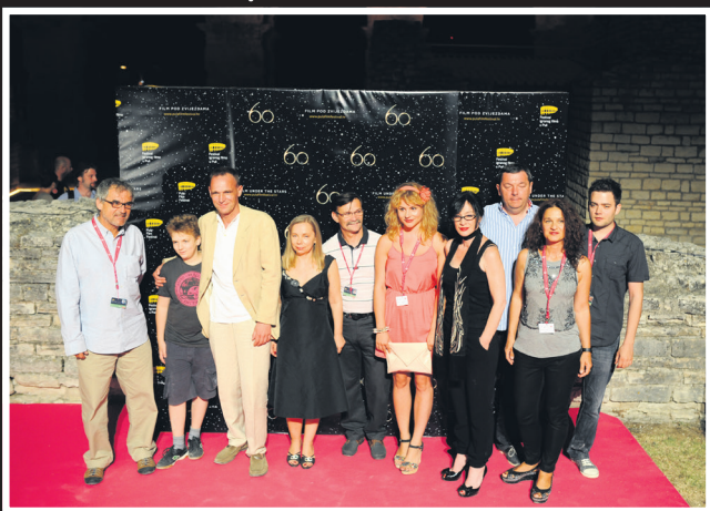
Ekipa filma Svećenikova djeca