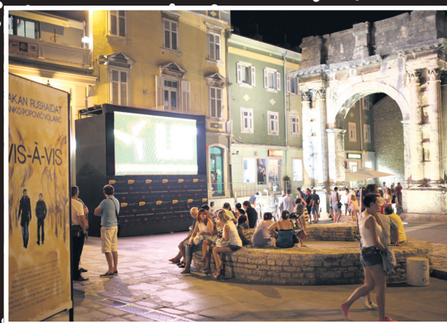
Mali predah uz film na Portarati