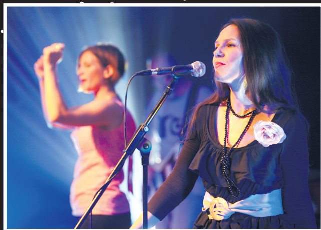
Svadbis - Circolo