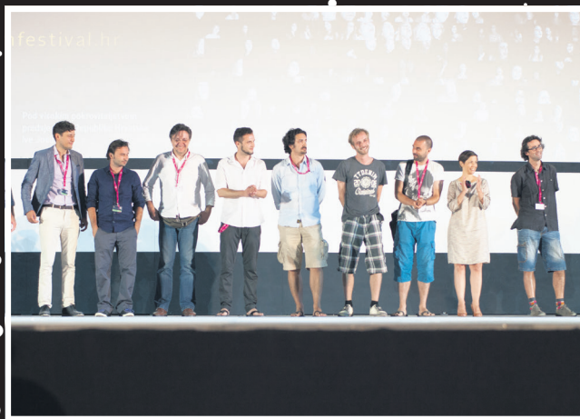
Ekipa filma Vis-a-Vis