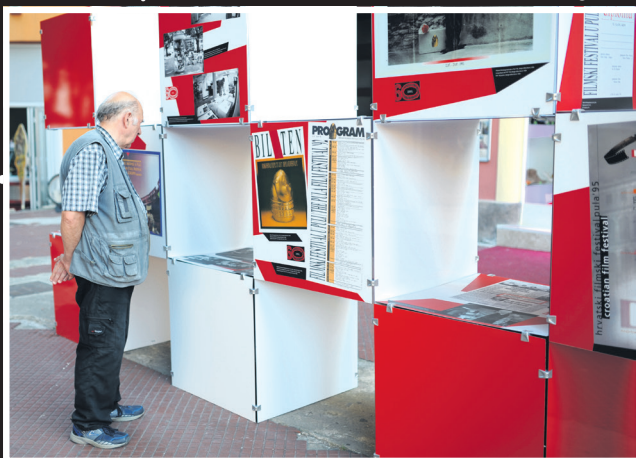
Zero Strasse - izložba koju treba vidjeti